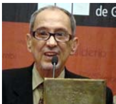
Bartolomeu Campos de Queirós

III Premio Iberoamericano SM de Literatura Infantil y Juvenil